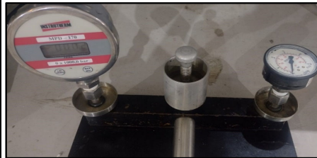
8.3 - FOTO DO INSTRUMENTO