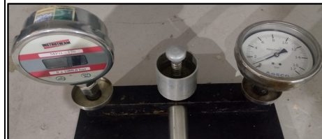
8.3 - FOTO DO INSTRUMENTO